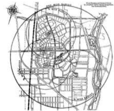
GENERAL PLAN SHOWING NEIGHBORHOODS

In their design of the suburb of Radburn in New Jersey, C. S. Shea and Henry Wright introduced a new approach to residential planning. They originated the superblock idea the main feature of which, is the separation of pedestrian and automobile traffic. At Radburn, houses are grouped around a series of cul-de-sacs which are linked by walkways with the park, the school, and the shops, all of which are located in the interior of the superblock. The superblock is considered an ideal solution to the circulation problem since it provides a means of locating the houses off the main road.