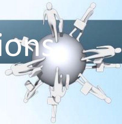
Table Locking and Transactions