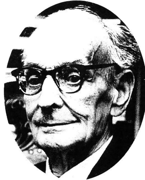
WALTER CHRISTALLER 1893–1969