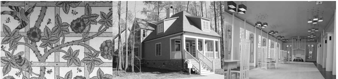
Karya-karya William Morris + CFA Voysey + Charles Rennie Mackintosh.

Inggris Raya Abad 20 – Art Nouveau di Perancis + Belgia, Jugendstil di Jerman, Sezession sebagai varian di Austria, Stile Liberty di Italia, dan Modernismo di Spanyol → bukti berkembangnya bibit-bibit AM. Di Inggris berkembang melalui para tokohnya William Morris + CFA Voysey + Charles Rennie Mackintosh .