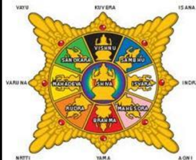
Diagram Surya Majapahit menampilkan tata letak para dewa Hindu di sembilan arah penjur utama mata angin.

Bentuk lain dari Surya Majapahit, dari reruntuhan candi Majapahit, Museum Nasional Jakarta.