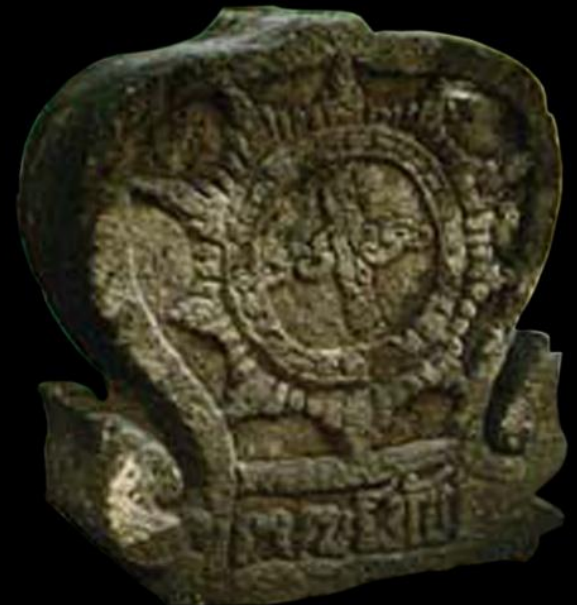
Lambang Kerajaan WILWATIKA (Majapahit) Ke - 3