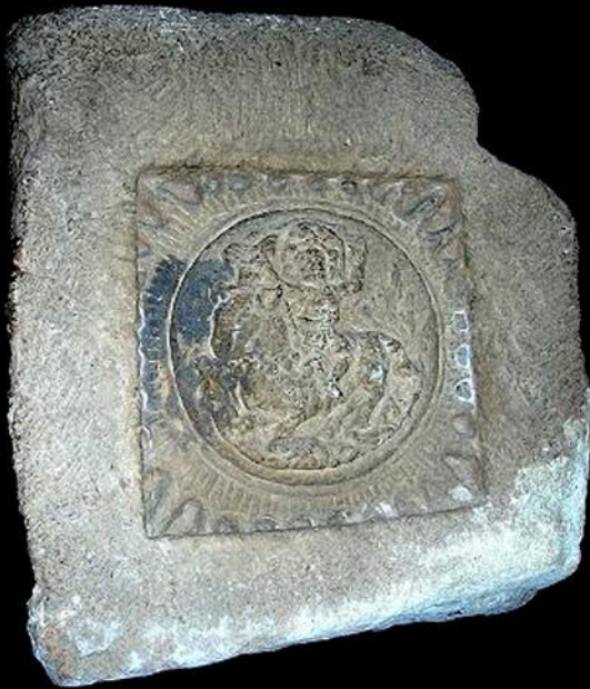
Lambang Kerajaan WILWATIKA (Majapahit) Ke - 1