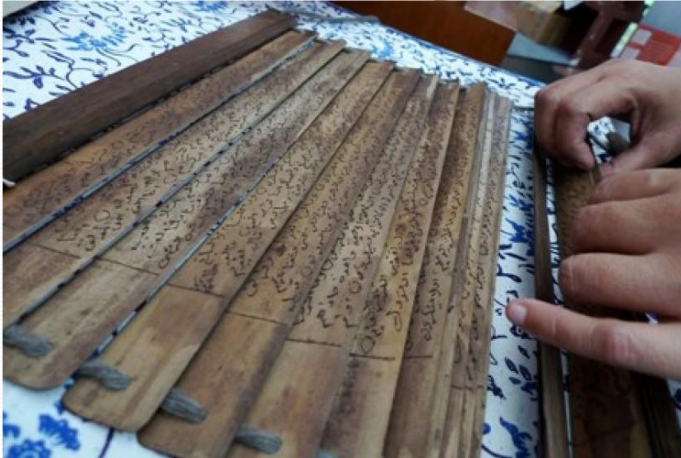
Salah satu contoh Mushaf Alquran kuno dari daun lontar