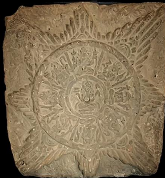
Lambang Kerajaan WILWATIKA (Majapahit) Ke - 2