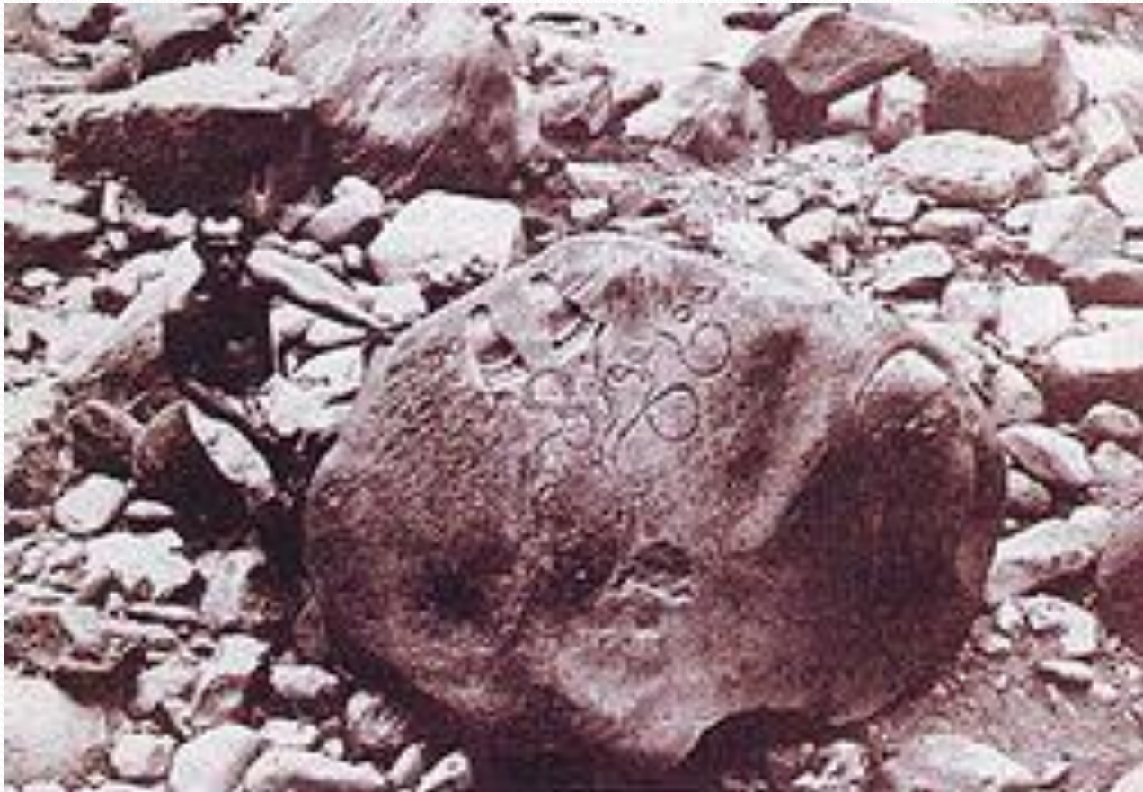
Prasasti Ciaruteun 417 M