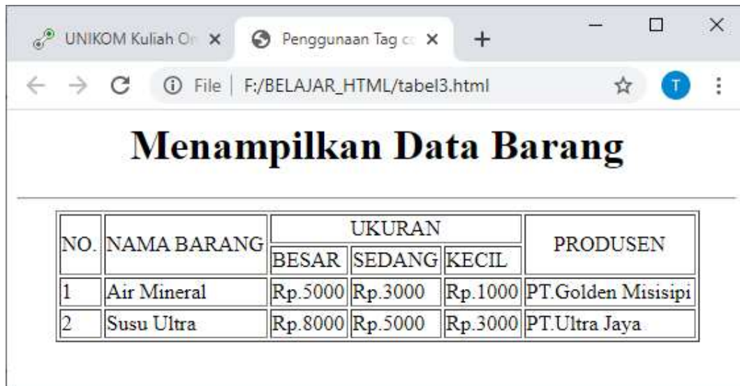
Gambar 4.3. Menggunakan Rowspan dan Colspan