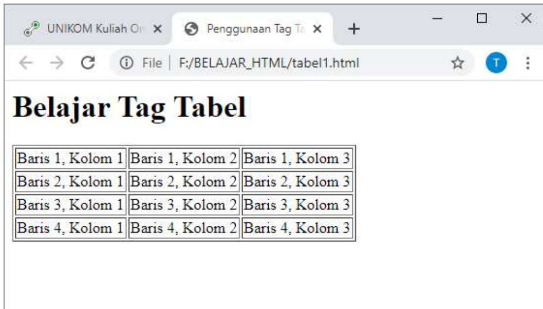
Gambar 4.1. Menampilkan Tabel

<td>Baris 2, Kolom 2</td> <td> Baris 2, Kolom 3</td> </tr> <tr> <td> Baris 3, Kolom 1</td> <td> Baris 3, Kolom 2</td> <td> Baris 3, Kolom 3</td> </tr> <tr> <td> Baris 4, Kolom 1</td> <td> Baris 4, Kolom 2</td> <td> Baris 4, Kolom 3</td> </tr> </table> </body> </html>