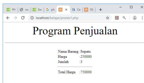
Gambar 4.2. Menampilkan Hasil Proses

Selanjutnya ketika program dijalankan dan di Click tombol Proses, maka hasilnya akan ditampilkan seperti pada gambar 4.2.