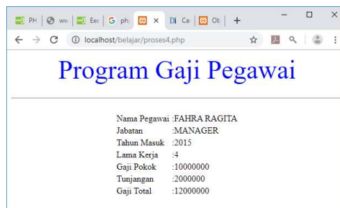
Gambar 4.8. Proses Objek Tipe Select

<?php echo "<center>"; echo "<font size=10>"; echo "<font color=blue>"; echo "Program Gaji Pegawai "; echo "<hr>"; echo "<table>"; $namapegawai=$_POST['namapegawai']; $jabatan=$_POST['jabatan']; $tahunmasuk=$_POST['tahunmasuk']; $lamakerja=2019 - $tahunmasuk; if($jabatan=="MANAGER") $gajipokok=10000000; if($jabatan=="MARKETING") $gajipokok=8000000; $tunjangan=0.05*$gajipokok*$lamakerja; $gajitotal=$gajipokok+$tunjangan; echo "<tr><td>Nama Pegawai<td>:$namapegawai"; echo "<tr><td>Jabatan<td>:$jabatan"; echo "<tr><td>Tahun Masuk<td>:$tahunmasuk"; echo "<tr><td>Lama Kerja<td>:$lamakerja"; echo "<tr><td>Gaji Pokok<td>:$gajipokok"; echo "<tr><td>Tunjangan<td>:$tunjangan"; echo "<tr><td>Gaji Total<td>:$gajitotal"; ?>