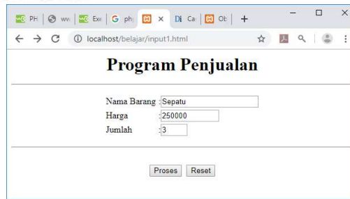
Gambar 4.1 Input Program Data Barang

Sedangkan untuk menangani form input tadi, dapat dilakukan dengan menggunakan perintah POST untuk membaca isi variabel yang dikirim.