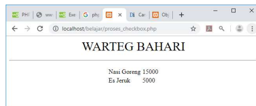
Gambar 4.6. Menangani Objek Tipe Checkbox

<?php error_reporting(0); echo "<center>"; echo "<font size=6>"; echo "WARTEG BAHARI"; echo "<hr>"; echo "<table>"; $nasigoreng=$_POST['nasigoreng']; if($nasigoreng) { $hnasgor=15000; echo "<tr><td>Nasi Goreng <td>$hnasgor"; } $esjeruk=$_POST['esjeruk']; if($esjeruk) { $hesjeruk=5000; echo "<tr><td>Es Jeruk<td>$hesjeruk"; } ?>