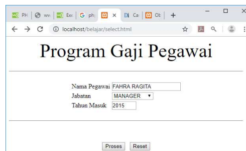
Gambar 4.7. Input Objek Select

<html> <form action="proses_select.php" method=post> <center> <font size=8> Program Gaji Pegawai <hr> <table> <tr><td>Nama Pegawai <td><input name=namapegawai size=20> <tr><td>Jabatan<td><select name=jabatan> <option>MANAGER <option>MARKETING <option>PRODUKSI <option>HRD <option>OB <tr><td>Tahun Masuk <td><input name=tahunmasuk size=4> </table> <hr> <input type=submit value=Proses> <input type=reset value=Reset>