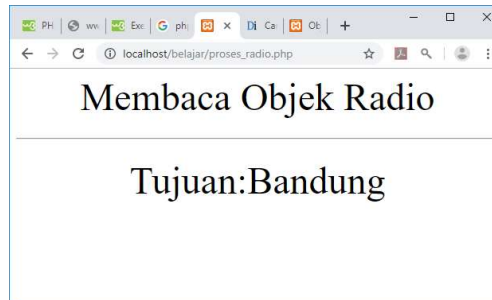
Gambar 4.4. Menampilkan data tipe Radio

<?php echo "<center>"; echo "<font size=8>"; echo "Membaca Objek Radio"; echo "<hr>"; $tujuan=$_POST['tujuan']; echo "<tr><td>Tujuan<td>:$tujuan"; ?>