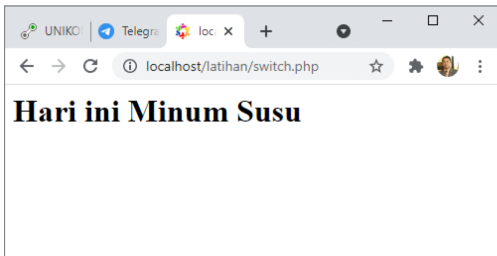
Gambar 13.3. Output Penggunaan switch case

<h1> <?php $minuman = "Susu"; switch($minuman){ case "Teh Manis": echo "Hari ini Minum Teh Manis"; break; case "Kopi": echo "Hari ini Minum Kopi"; break; case "Susu": echo "Hari ini Minum Susu"; break; case "Jus Jeruk": echo "Hari ini Minum Jus Jeruk"; break; default: echo "Tidak minum apa apa"; } ?>