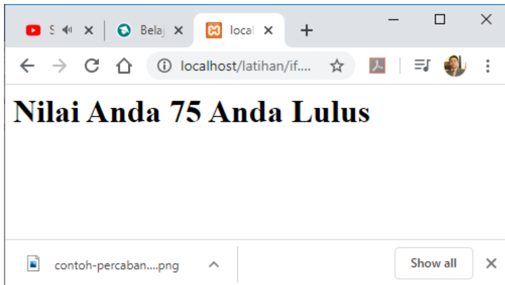
Gambar 13.1.Output Program if.php

<?php $nilai=75; if ($nilai>=70){ echo "Nilai Anda $nilai Anda Lulus"; } ?>