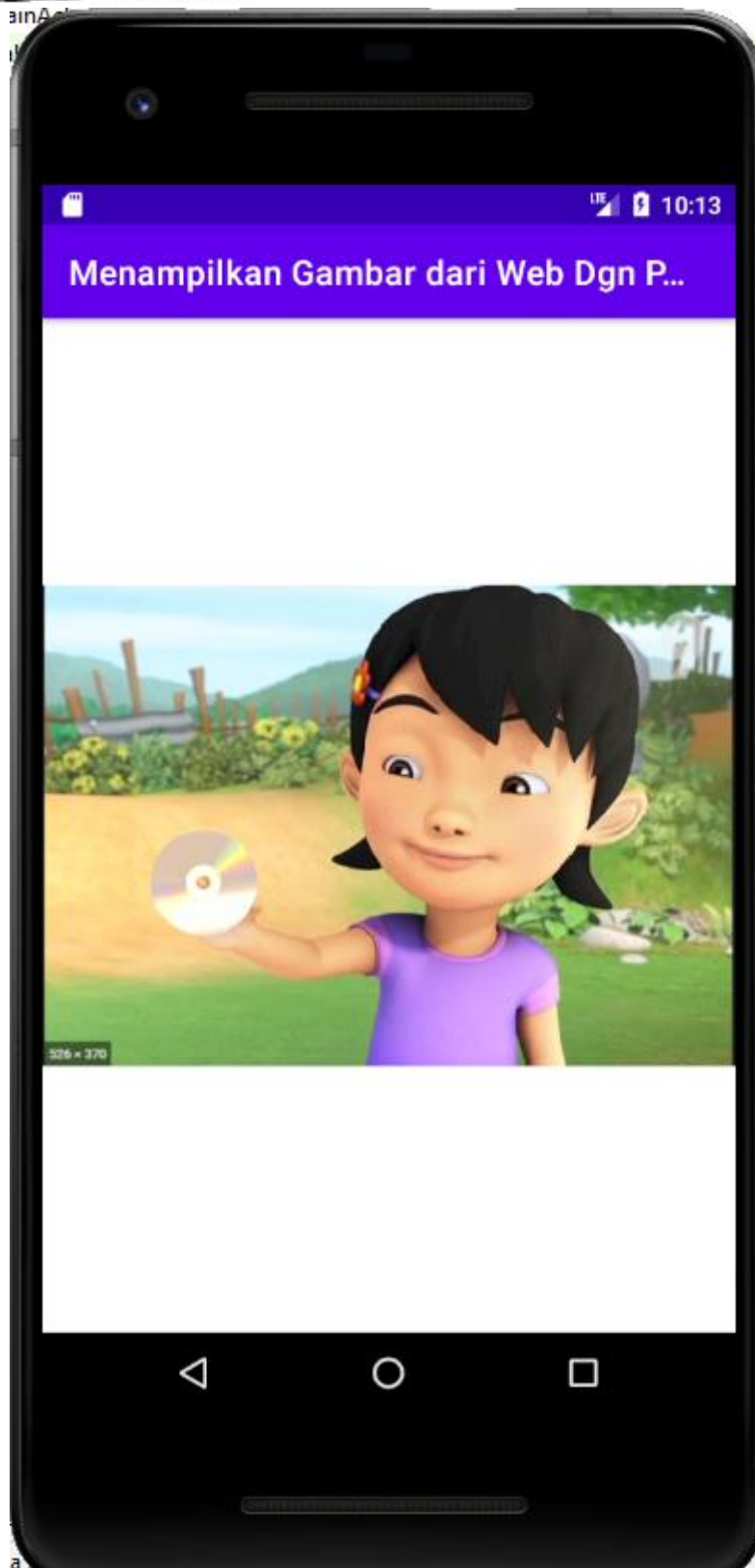
Contoh Hasil Tampilan Program