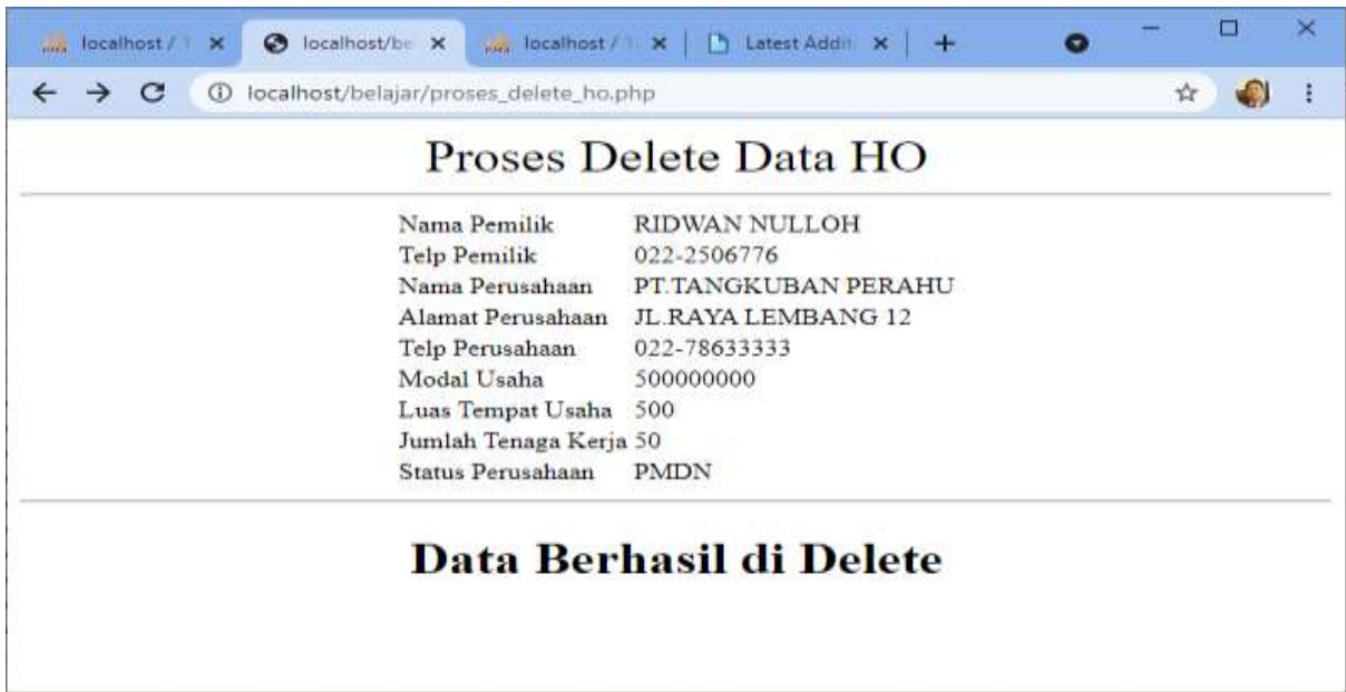
Gambar 7.3. Halaman Browser File: PROSES_DELETE_HO.PHP