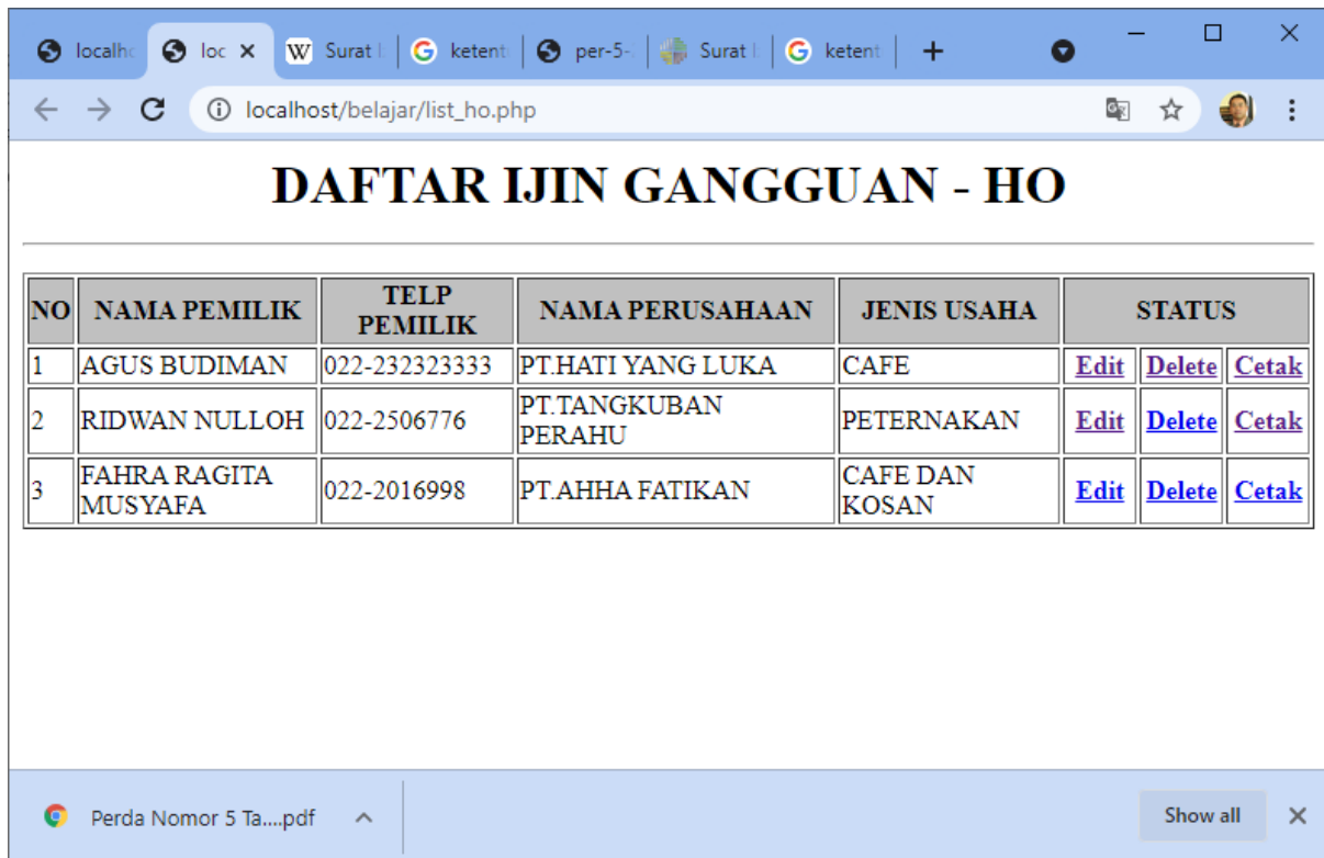
Gambar 7.1. Halaman Browser File: LIST_HO.PHP

Jalankan Melalui Browser, akan ditampilkan hasil seperti berikut: