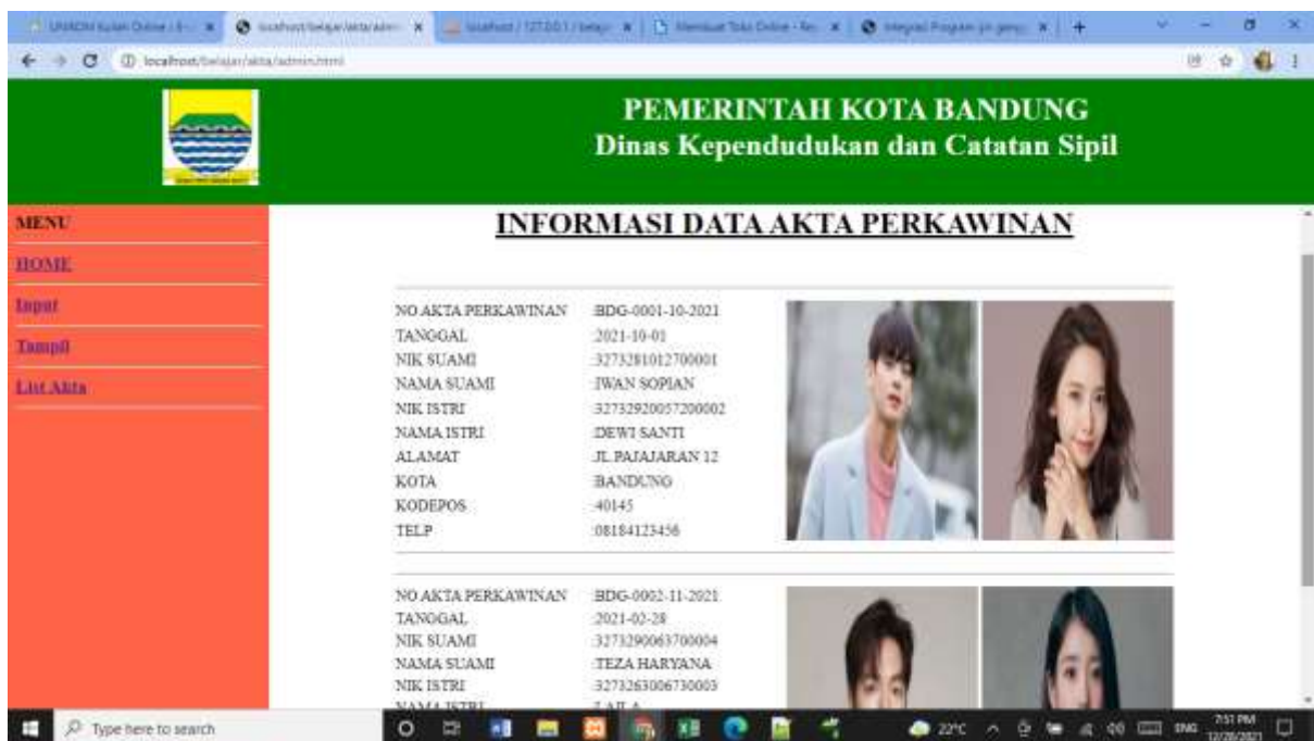
Gambar 10.3 Menampilkan Data Akta Perkawinan