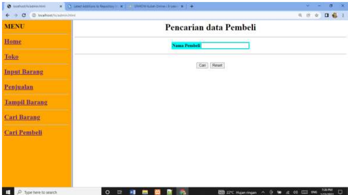
Gambar 15.7. Menampilkan Data Pembeli