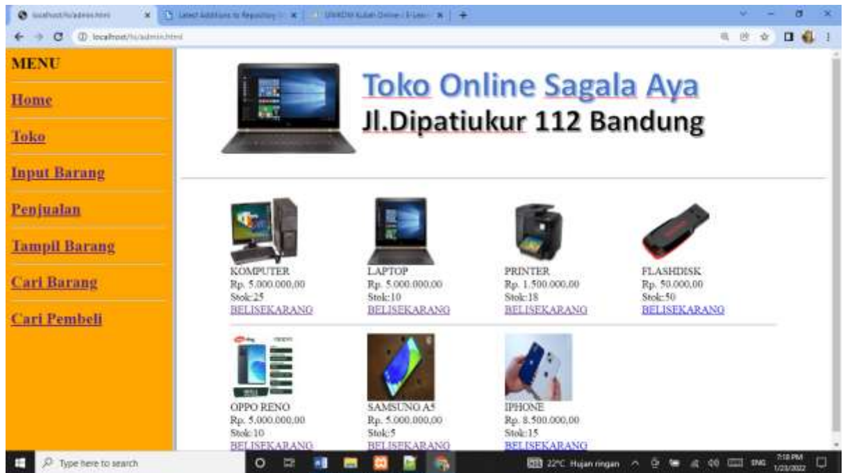
Gambar 15.2. Menampilkan Toko Online