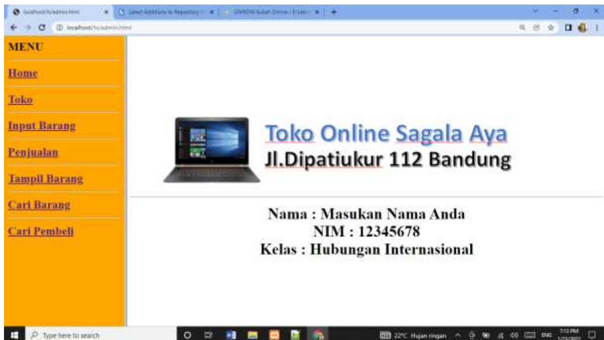
Gambar 15.1. Jendela Admin utama

Akan ditampilkan jendela seperti berikut: