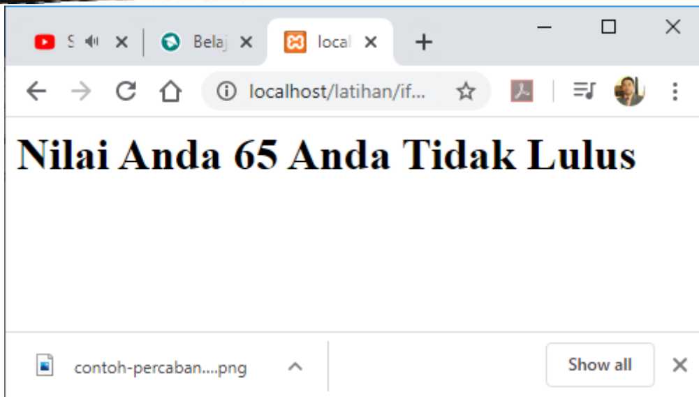
Gambar 5.2. Output Program ifelse.php