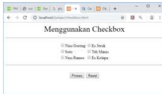
Gambar 10.5. Objek Tipe Checkbox

Untuk membaca data dengan tipe checkbox dapat dilakukan dengan membaca value dari objek tersebut, jika isi value adalah on artinya dipilih.