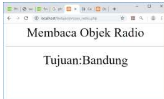
Gambar 10.4.Menampilkan data tipe Radio

<?php echo "<center>"; echo "<font size=8>"; echo "Membaca Objek Radio"; echo "<hr>"; $tujuan=$_POST['tujuan']; echo "<tr><td>Tujuan<td>:$tujuan"; ?>