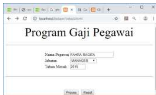
Gambar 10.7. Input Objek Select

<html> <form action="proses_select.php" method=post> <center> <font size=8> Program Gaji Pegawai <hr> <table> <tr><td>Nama Pegawai <td><input name=namapegawai size=20> <tr><td>Jabatan<td><select name=jabatan> <option>MANAGER <option>MARKETING <option>PRODUKSI <option>HRD <option>OB <tr><td>Tahun Masuk <td><input name=tahunmasuk size=4> </table> <hr> <input type=submit value=Proses> <input type=reset value=Reset>