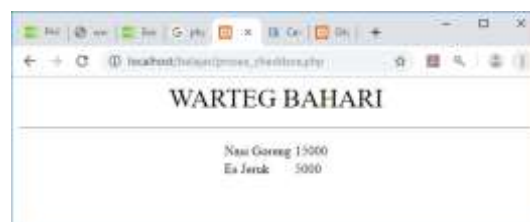
Gambar 10.6. Menangani Objek Tipe Checkbox

<?php error_reporting(0); echo "<center>"; echo "<font size=6>"; echo "WARTEG BAHARI"; echo "<hr>"; echo "<table>"; $nasigoreng=$_POST['nasigoreng']; if($nasigoreng) { $hnasgor=15000; echo "<tr><td>Nasi Goreng <td>$hnasgor"; } $esjeruk=$_POST['esjeruk']; if($esjeruk) { $hesjeruk=5000; echo "<tr><td>Es Jeruk<td>$hesjeruk"; } ?>