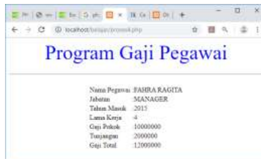
Gambar 10.8. Proses Objek Tipe Select

<?php echo "<center>"; echo "<font size=10>"; echo "<font color=blue>"; echo "Program Gaji Pegawai "; echo "<hr>"; echo "<table>"; $namepegawai=$_POST['namepegawai']; $jabatan=$_POST['jabatan']; $tahunmasuk=$_POST['tahunmasuk']; $lamakerja=20110 - $tahunmasuk; if($jabatan=="MANAGER") $gajipokok=10000000; if($jabatan=="MARKETING") $gajipokok=8000000; $tunjangan=0.05*$gajipokok*$lamakerja; $gajitotal=$gajipokok+$tunjangan; echo "<tr><td>Nama Pegawai<td>:$namepegawai"; echo "<tr><td>Jabatan<td>:$jabatan"; echo "<tr><td>Tahun Masuk<td>:$tahunmasuk"; echo "<tr><td>Lama Kerja<td>:$lamakerja"; echo "<tr><td>Gaji Pokok<td>:$gajipokok"; echo "<tr><td>Tunjangan<td>:$tunjangan"; echo "<tr><td>Gaji Total<td>:$gajitotal"; ?>