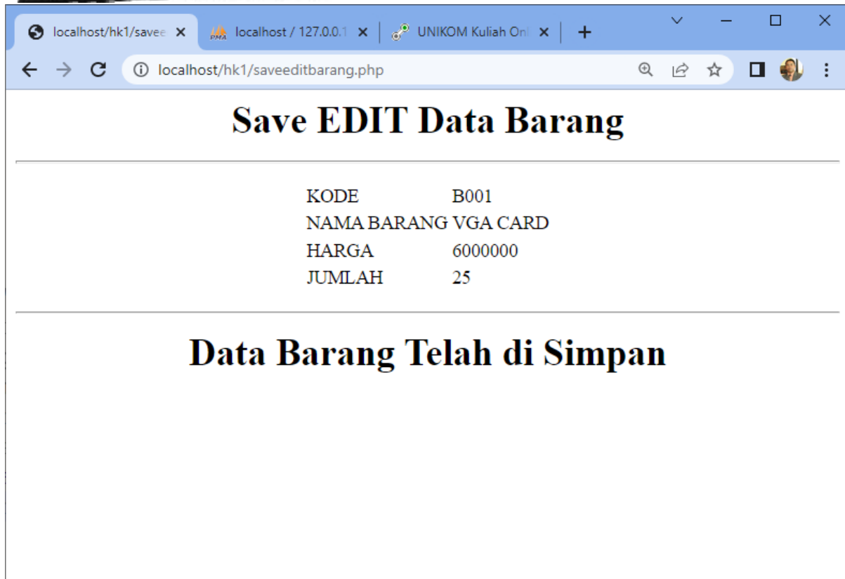
Gambar 13.3. Menyimpan Data Kedalam Tabel Barang

Setelah proses ini Data Barang yang ada di dalam database atau table akan terupdate.