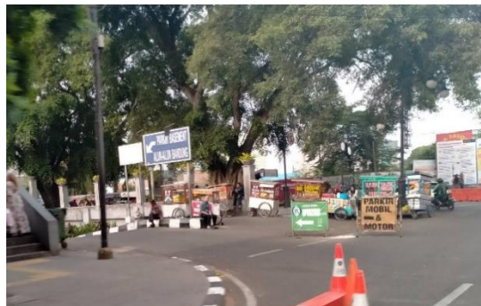
(Sumber : Hasil Observasi Peneliti, 2020)

Namun, berdasarkan hasil observasi peneliti hanya ada satu kekurangan yang dimiliki oleh parkir basement alun-alun kota Bandung dalam strategi aksesibilitas mengatasi pelanggaran parkir yaitu rambu petunjuk jalan menuju parkir basement alun-alun kota Bandung sangatlah minim, seperti contoh gambar dibawah