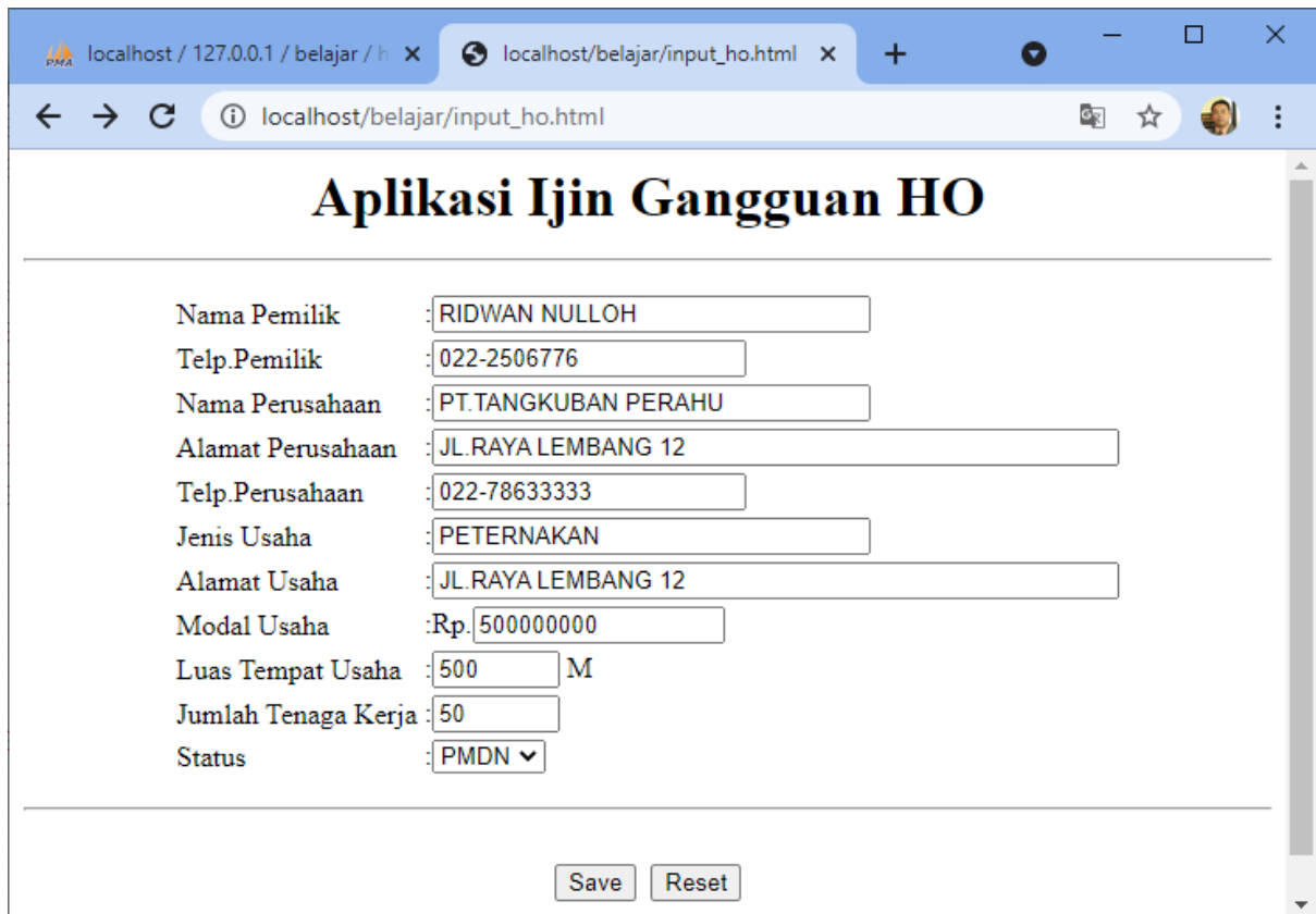
Menjalankan Program Input data HO

Setelah kedua program dibuat, selanjutnya adalah menjalankannya dengan cara memanggil file:input_ho.html dari browser