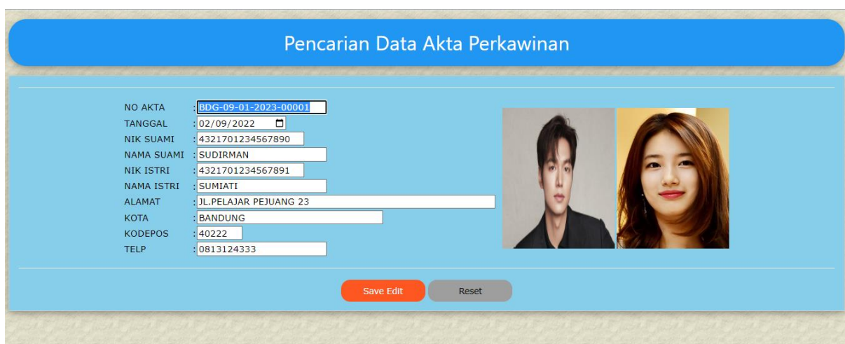
Gambar 14.2. Hasil Pencarian Edit Data Perkawinan