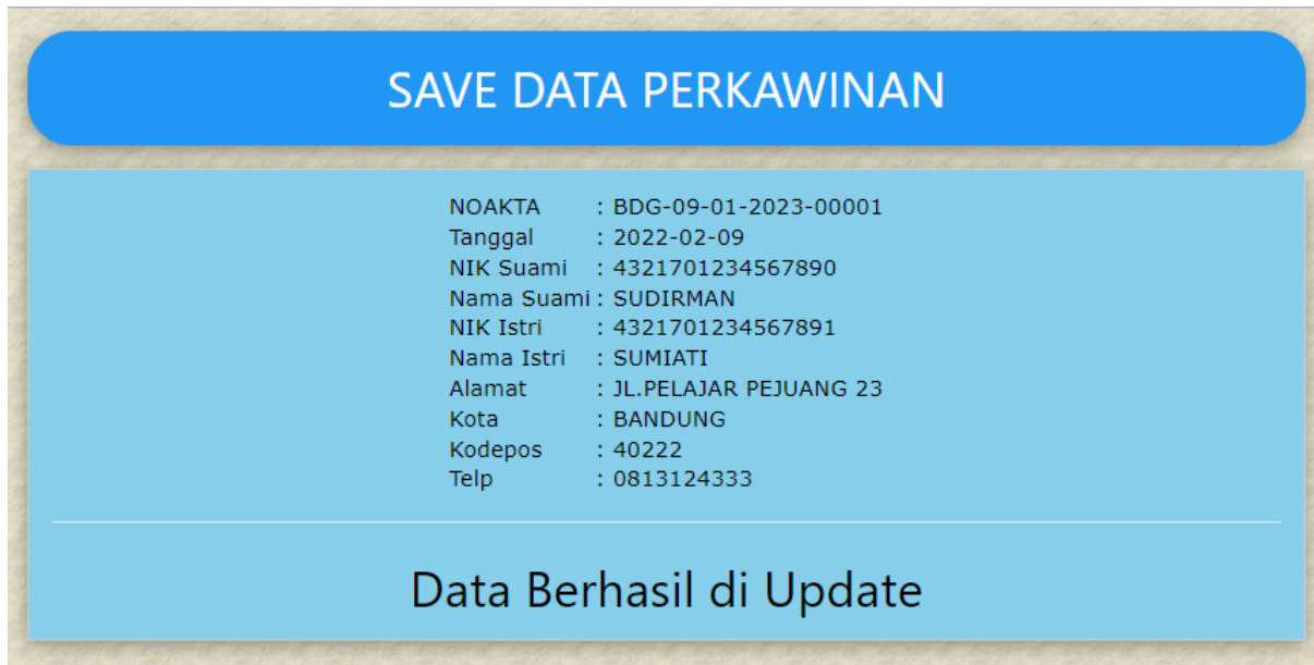
Gambar 14.4. Menyimpan Data yang Sudah di Edit

Anda dapat melakukan perbaikan pada form di atas sesuai dengan data yang ingin dirubah atau diperbaiki, kemudian Click tombol Save_Edit, untuk menyimpan perubahan tersebut, dan selanjutnya akan ditampilkan layar seperti berikut: