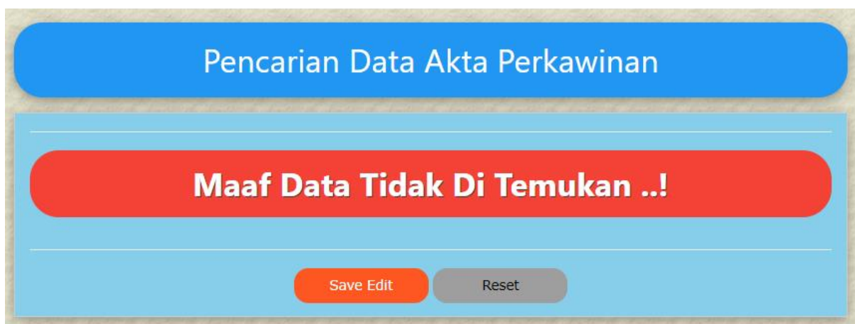
Gambar 14.5. NOAKTA yang dicari tidak ada

Jika data yang akan di Edit, tidak ada dalam database, maka akan ditampilkan jendela seperti berikut: