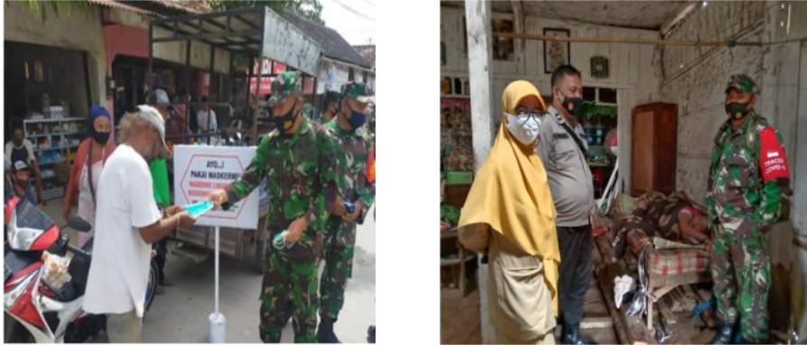
Gambar 4. Sosialisasi Covid-19 oleh Babinsa

Kodim 0816 dalam proses sinergitas dengan Kabupaten Sidoarjo yaitu dengan memberikan pembinaan kepada masyarakat. Pembinaan yang dilakukan melalui langkah Persuasi pembatasan kerumunan, Perkuat soliditas warga, Pengendalian aktivitas social. Babinsa memberikan sosialisasi dan meyakinkan masyarakat bahwa vaksinasi covid 19 aman diberikan kepada seluruh masyarakat dan mengeliminir hoax yang berkembang.