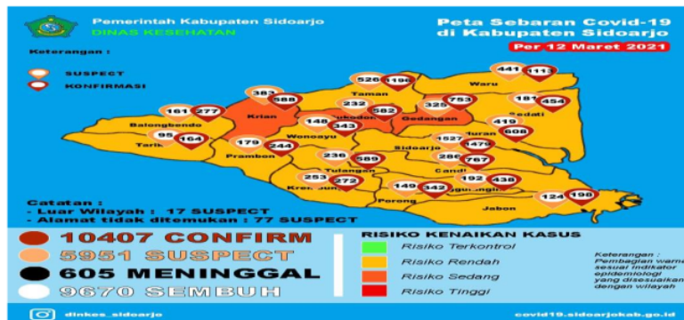
Gambar 2. Peta Sebaran Covid-19 di Kabupaten Sidoarjo

Berdasarkan data di atas, Kecamatan yang penambahan jumlah terkonfirmasi positif Covid-19nya terbanyak yaitu Kecamatan Taman sebanyak 7 orang.