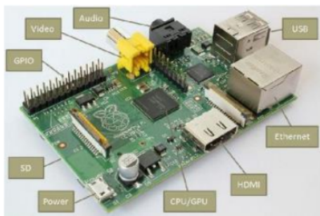
Gambar 2. Raspberry Pi [20]

Raspberry Pi mempunyai OS yang berbasis Debian Linux dengan nama Raspbian dan terpasang bahasa pemrograman python untuk pengembangan aplikasi pada Raspberry termasuk merekam kamera. Varian Raspberry yang dipilih untuk pengembangan sistem ini adalah Raspberry Pi 3, hal ini disebabkan kebutuhan modul on-board wifi wireless LAN untuk pengiriman data video secara wireless dan sekaligus kebutuhan kamera dalam hal ini dipakai Pi Camera [21] untuk keperluan fungsi perekam data video, dimana kedua hal tersebut dapat disediakan oleh Raspberry Pi 3. Sistem operasi bawaan Raspberry Pi 3 adalah Raspbian Stretch. Pada gambar 3 merupakan komponen dari Raspberry Pi.