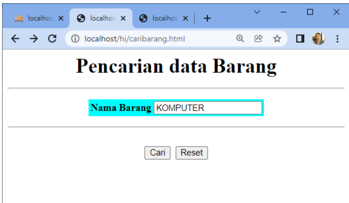
Gambar 5.6. Menjalankan program caribarang.html