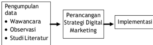
Gambar 1 : Konsep Pengumpulan Data

Metode penelitian yang digunakan yaitu deskriptif kualitatif melalui pengumpulan data yang diperoleh dari Erna Sari Catering melalui: wawancara, survey, studi literatur, observasi, perancangan strategi dan penerapan.