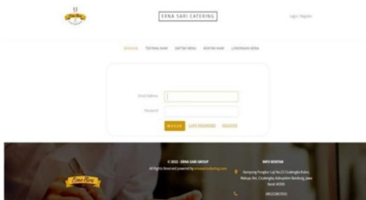
Gambar 3. Tampilan Halaman Utama

Sistem yang digunakan dalam mengembangkan usaha Erna Sari Catering adalah sistem yang berbasis web yang dimana sistem tersebut memiliki alamat web https://ernasari catering.com/ sehingga memudahkan Erna Sari Catering dalam mengelola bisnisnya, seperti menambah dan mengurangi hal-hal yang diperlukan dan yang tidak diperlukan, menentukan harga produk, mengetahui berapa banyak produk yang telah terjual habis, dan bisa menambah menu baru sesuai kebutuhan. Dalam tampilan sistem tersebut terdapat halaman utama yang memuat beberapa menu seperti tentang sejarah Erna Sari Catering, menu makanan, menu untuk mendaftar pada website, menu untuk admin dan menu tampilan logo Erna Sari Catering.