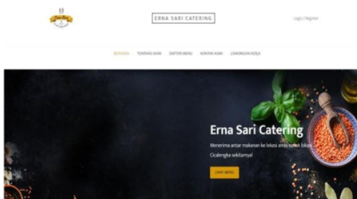
Gambar 2. Tampilan Sistem

informasi ini akan memberikan kesempatan pada usaha Erna Sari Catering untuk meraih pasar yang lebih luas melalui penerapan pemasaran digital marketing berbasis website. Dengan jangkauan digital marketing yang luas memungkinkan usaha Erna Sari Catering dapat menjangkau lebih banyak pelanggan. Pemanfaatan perkembangan informasi melalui digital marketing, Erna Sari Catering dapat memberikan informasi penjualan dan informasi lowongan pekerjaan yang dimana selain dapat memasarkan produknya, Erna Sari Catering dapat memberikan informasi tentang lowongan pekerjaan secara online sehingga dapat membantu program pemerintah dalam mengurangi tingkat pengangguran serta memudahkan Erna Sari Catering dalam pengelolaan transaksi serta pelaporan menggunakan sistem yang ada.