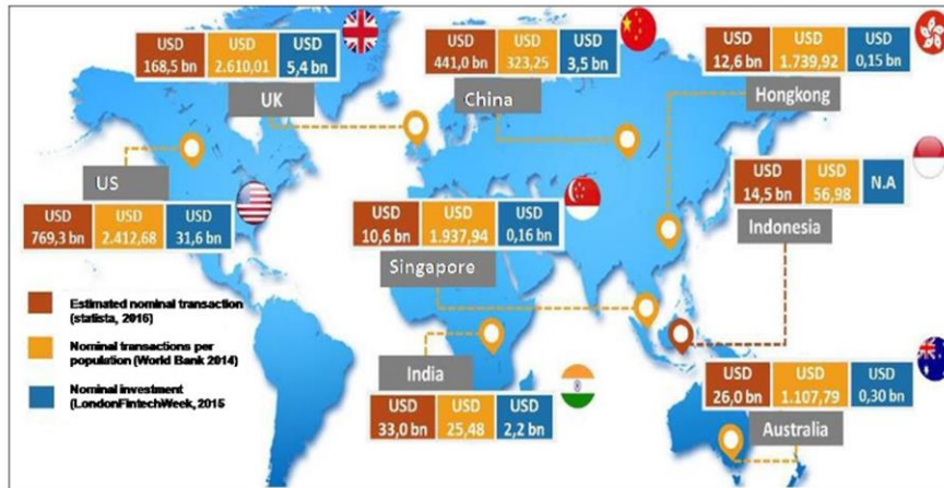
Gambar 2. Transaksi Fintech di dunia

AS, Cina, dan Inggris telah maju pesat dalam hal kemampuan fintech ketika banyak negara Asia mulai meningkatkan kecepatannya. Menurut laporan statistik yang memiliki nilai transaksi fintech tertinggi dari seluruh dunia pada tahun 2016, yakni AS, kemudian China, dan Inggris. Angka-angka ini bertujuan untuk mengukur kapasitas transaksi (dan bukan pendapatan perusahaan) yang mencakup keuangan pribadi, pembayaran digital, dan keuangan bisnis. Ini termasuk instrumen keuangan alternatif dan layanan keuangan digital, transaksi pembayaran digital, pinjaman pasar untuk pinjaman bisnis dan individu, penasihat keuangan dan manajemen layanan properti otomatis, pengeluaran ventura, dan juga crowd-funding online.