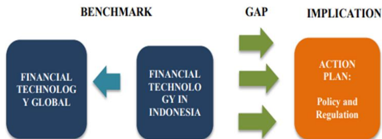
Gambar 1. Data Sebelumnya

Berdasarkan Gambar 1, pengumpulan data dan penelitian sebelumnya tentang teknologi keuangan global merupakan tahap awal dari penelitian ini, dan juga tentang implikasi negara lain dan sejarah teknologi keuangan yang ada. Selanjutnya, analisis dan pendataan terkait financial technology di Indonesia seperti kasus dan tantangan yang dihadapi Indonesia dalam hal financial technology. Hasil analisis tersebut akan dijadikan sebagai saran dan kritik bagi pemerintah, lembaga keuangan, dan regulator di OJK Indonesia.