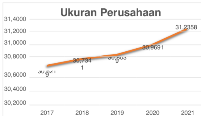
Gambar 2. Rata-rata Ukuran Perusahaan

Berikut adalah nilai rata-rata ukuran perusahaan dari tahun 2017-2021 :