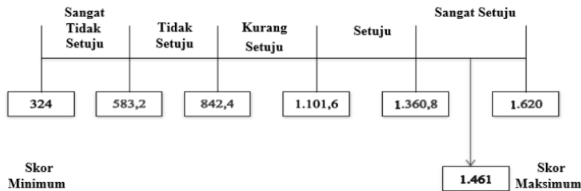
Gambar 3. Skor Interval Pencegahan Kecurangan

Rekapitulasi variabel Pencegahan Kecurangan memiliki kategori “Sangat Setuju” penyebabnya variabel termasuk dalam interval dikisaran antara “1361,8- 1.620”. bila dari beberapa pernyataan yang dijawab oleh responden yaitu Sistem pemberian penghargaan ataupun hukuman bagi karyawan telah dijalankan secara proporsional dengan perolehan skor total 171 dari 1.461 atau 11,70% dengan Gap sebesar 5%. Maka dapat diketahui bahwa variabel Pencegahan Kecurangan sudah dalam kondisi sangat baik. Maka dapat diketahui bahwa variabel Pencegahan Kecurangan sudah dalam kondisi sangat baik. Kemudian dapat dilihat pada garis kontinum berikut ini :