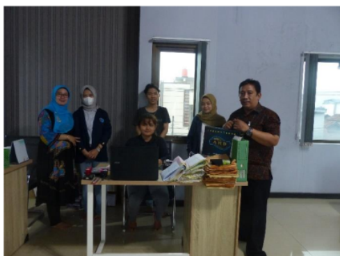
Gambar 6. Persiapan Tim PkM dan Sebagian Peserta Pelatihan