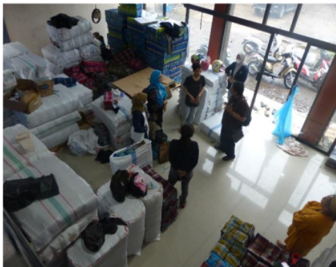
Gambar 1. Pabrik Sarung CV Mekar Jaya

CV. Mekar Jaya yang terletak di Jl. Raya Laswi Ciwalengke No. 133 Kecamatan Majalaya Kabupaten Bandung, Jawa Barat 40382, termasuk pengusaha UKM di daerah Kabupaten Bandung dan pabrik textile skala mikro kecil di ibu kota provinsi Jawa Barat ini. Hasil produksinya sarung, bahan baku sarung dan kain (contoh benang), bahan baku lainnya, tempat penyimpanan bahan baku pembuatan sarung dan gudang sarung.