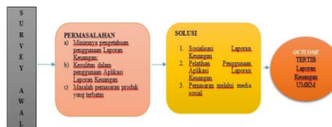
Gambar 2. Skema Solusi Permasalahan

Deskripsi lengkap bagian metode pelaksanaan untuk mengatasi permasalahan dalam gambar sesuai tahapan sebagai berikut :