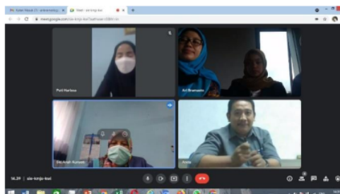
Gambar 5. Ketua LPPM Langlangbuana ikut bergabung secara daring