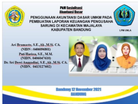
Gambar 4. Backdrop Kegiatan Program Kemitraan Masyarakat