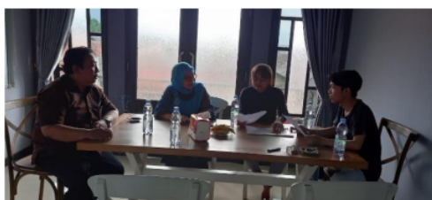
Gambar 7. Evaluasi Program Kemitraan Masyarakat