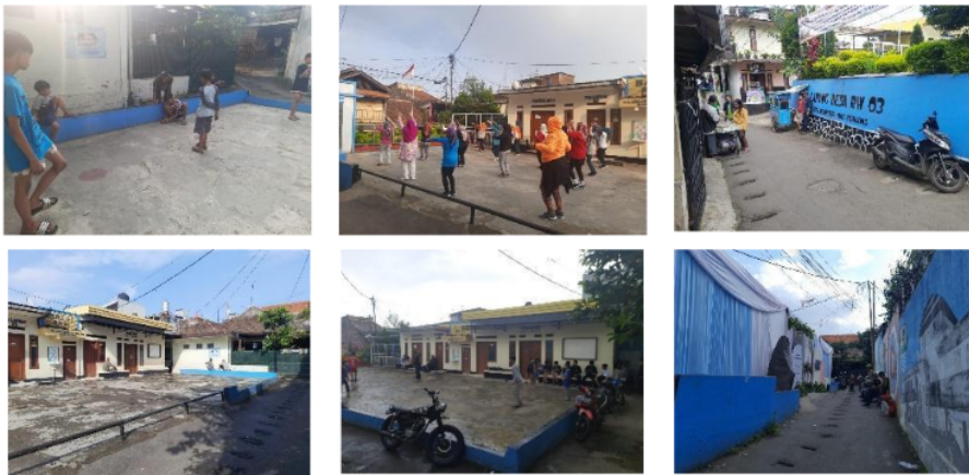
Gambar 3: Aktivitas Lapangan Desa Dimasa Pandemi

Lapangan sebagai tempat yang paling banyak digunakan, sesuai dengan hasil penelitian yang ditulis oleh Sagara (2021), yang memuat kluster penyebaran virus COVID-19 di dalam ruangan lebih cepat dibandingkan di luar ruangan, terlebih jika sistem ventilasi pada ruangan buruk. WHO Indonesia juga menyebutkan adanya kemungkinan udara sebagai media penularan virus COVID-19. Hal ini yang mempengaruhi masyarakat dalam menggunakan ruang komunal cenderung menggunakan ruangan terbuka dan tidak berlama-lama pada ruangan tertutup. Terlebih di masa kini masyarakat sudah banyak bisa melakukan aktivitas pada ruang terbuka yang pada sebelum-sebelumnya dibatasi (Gambar 3).