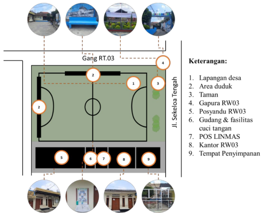
Gambar 2. Siteplan Lokus Pengamatan

Data didapatkan dengan mengamati penduduk yang menggunakan ruang komunal dan diamati: 1) ruang yang digunakan; 2) lama penggunaan ruang; 3) aktivitas yang dilakukan; 4) pelaku ruang; 5) sistem protokol kesehatan. Pengamatan dilakukan pada bulan Juni tahun 2022. Pengamatan dilakukan mulai dari hari senin-hingga minggu pada waktu yang tidak tentu disiang hari selama lebih kurang 1 jam.