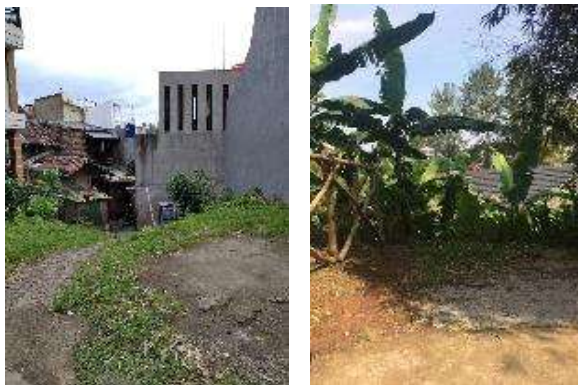
Gambar 4 Jalan tembus antar permukiman

Selain ruang-ruang yang telah direncanakan tersebut di atas, ternyata ada ruang-ruang lain yang tidak terduga menjadi tempat paling disukai anak baik di perumahan Kampung Padi, Cigadung dan Sadang Serang, yaitu ruang sekitar jalan tembus dan lahan berlebih pinggir Jalan. Ruang-ruang ini tidak terduga disukai anak-anak karena ternyata menjadi ruang yang dapat diakses anak-anak menuju ruang lain, juga anak merasa memiliki otoritas atas ruang tersebut seperti yang terlihat pada Gambar 4. Sebetulnya, jalan tembus tersebut merupakan lahan kosong yang masih belum terbangun. Lahan kosong ini memungkinkan dua jenis permukiman saling berbaur satu sama lain.