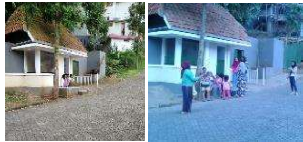
Gambar 2 Pos jaga sebagai tempat bermain

dan bermain di sekitar pos satpam seperti diperlihatkan pada Gambar 2. Terkadang orang tua bahkan penjaga kompleks ikut terlihat bermain bersama dalam kegiatan bersama anak-anak tersebut. Pada momen ini, terjadi kegiatan pengasuhan ataupun transfer pola bermain dari orang dewasa kepada anak-anak, sehingga beberapa jenis permainan tradisional pun diperkenalkan kepada anak-anak. Anak juga merasa aman ketika bermain pada area ini.