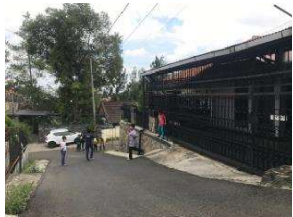
Gambar 3 Jalan sebagai tempat bermain

Bermain di jalan (ruang aksesibilitas) ini paling disukai karena memiliki kedekatan dengan ruang gerak anak-anak, ketika mereka bergerak menuju satu lokasi bermain satu ke lokasi yang lainnya lagi. Ruang aksesibilitas menjadi pilihan anak untuk sekedar mengobrol, bermain sepeda, bermain kejar-kejaran ataupun permainan yang disebabkan adanya kegiatan hari besar seperti pada Gambar 3. Gambar tersebut memperlihatkan, anak-anak yang sedang menjalani sekolah daring, tetap melakukan kegiatan ibadah salat Jumat ke masjid. Anak-anak dari lokasi permukiman tidak terencana melakukan kegiatan salat di masjid permukiman terencana, melalui jalan lintas, sambil melakukan kegiatan bermain.