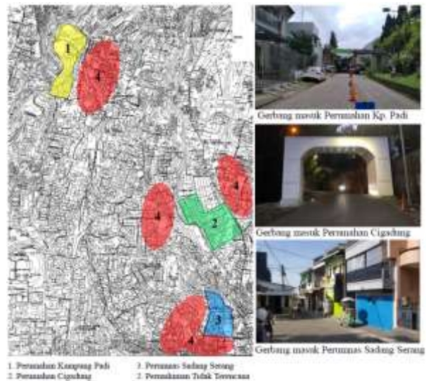
Gambar 1 Lokasi dan gerbang masuk permukiman terencana

Berikut gambaran lokasi dari ketiga Permukiman yang akan diteliti, ketiga permukiman tersebut letaknya berdampingan dengan permukiman yang tidak terencana. Gambar 1 menunjukkan lokasi dan gerbang atau akses masuk pada masing-masing Permukiman terencana.