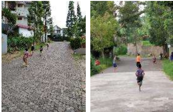
Gambar 5 Jalan sebagai fasilitas jenis permainan bergerak dengan atau tanpa alat

tempat bermain anak yang bersifat bergerak. Anak-anak berlarian, kemudian diam pada tempat tertentu untuk bermain jenis permainan tertentu, kemudian bergerak kembali sambil berjalan atau berlarian.