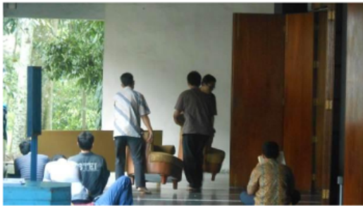
Gambar 1. Mahasiswa penghuni asrama Masjid Salman maupun mahasiswa di luar ITB bahu membahu menyiapkan setting acara

Kedekatan dengan masjid tercermin melalui aktivitas yang terkadang dilakukan dalam jangka waktu yang cukup panjang, sehingga rela untuk tidak pulang dan menginap di area masjid. Disini muncul sikap patronisme kaum aktivis untuk tetap berkegiatan walau harus mengorbankan waktu mereka.