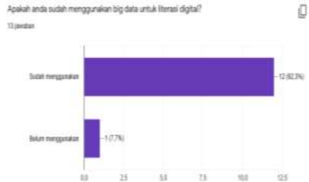
Tabel 3. Penggunaan big data untuk literasi digital

Sementara itu, 92.3 persen responden mengatakan sudah menggunakan big data untuk literasi digital, seperti pada tabel 3.