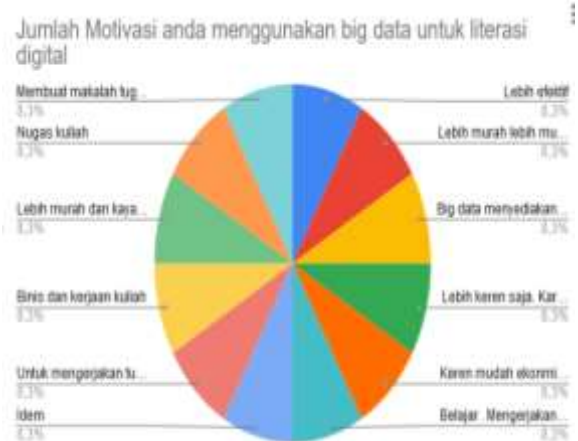
Tabel 5. Motiasi menggunakan big data untuk literasi digital

untuk belajar dan mengulik bagaimana literasi digital dilaksanakan. Bahkan ada beberapa informan yang menggunakan literasi digital ini untuk keperluan di luar dunia kampus, yakni untuk urusan bisnis dan hiburan.