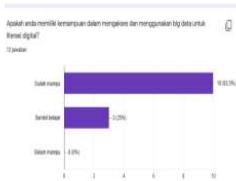
Tabel 4. Kemampuan menggunakan big data untuk literasi digital

mahasiswa menggunakan big data terlihat pada tabel 4.