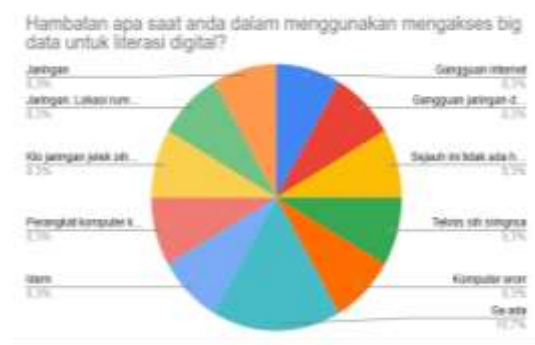
Tabel 6. Hambatan menggunakan big data

Sebagian mahasiswa Bandung berasal dari daerah yang bisa dikatakan tertinggal dalam hal infrastruktur internetnya. Hal ini sangat berpengaruh terhadap kelancaran melaksanakan literasi digital mereka. Salah seorang mahasiswa berasal dari daerah di luar pulau Jawa mengaku, saat mereka pulang ke sana, kesulitan untuk membuka internet. Karena itu, disaat ada aktivitas perkuliaan secara online ia harus pergi ke pusat kota kecamatan dimana sinyal internet melalui handphonenya relatif stabil. Namun demikian ada juga informan yang mengaku tidak mendapatkan hambatan.