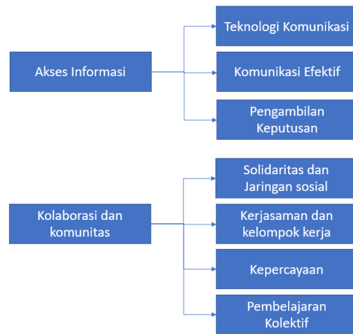
Gambar 2 Pengolahan teks wawancara Tema dan Kategori.

PPM dianggap sebagai pengembangan sektor pertanian di Kota Bandung. Program yang melibatkan partisipasi banyak pihak ini menciptakan peluang baru bagi generasi muda untuk berperan aktif dalam menciptakan masa depan pertanian yang lebih berkelanjutan dan inklusif (Haryanto et al., 2022).