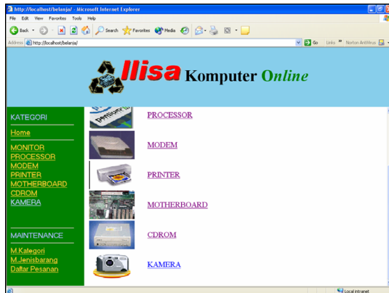
Contoh Penambahan kategori KAMERA

Click tombol Submit, apabila akan menyimpan data tersebut, atau click Back, untuk membatalkannya. Jika data berhasil disimpan, maka pada layar utama akan masuk kategori yang baru beserta gambar dari katategori tersebut.