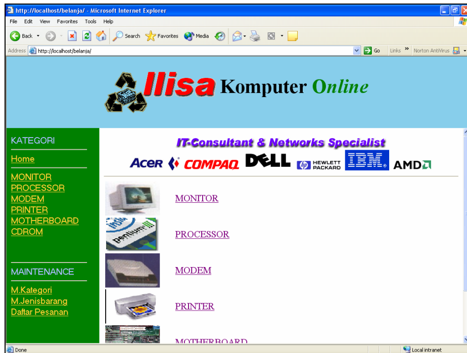
Tampil Utama Toko Komputer Online

Pertama Buat Tampilkan Depan Seperti berikut: