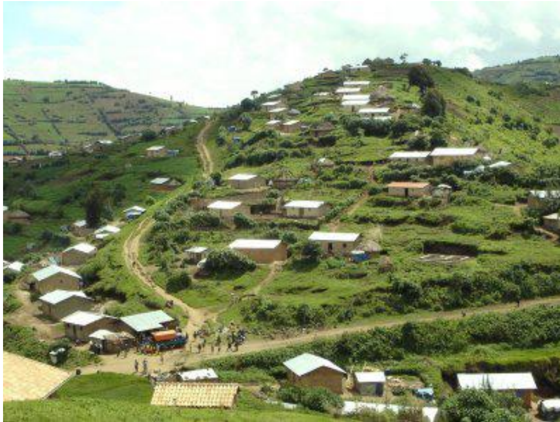
Rural settlement in Rwanda (Africa)