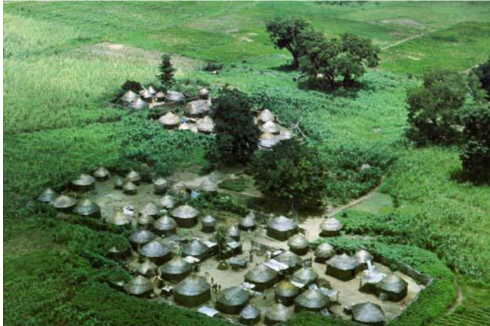
Rural settlement in Nigeria (Africa)