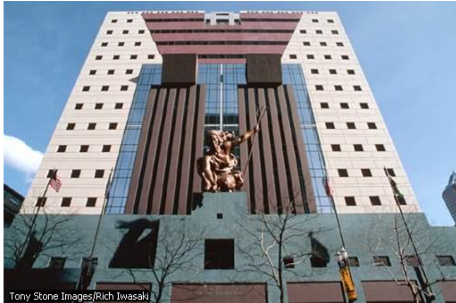
Portland Building. The Portland Building, opened in 1982, is one of the earliest monuments of postmodern architecture. Incorporating both ornamentation and sculpture (the allegorical figure Portlandia), the structure represents a break with the austere functionalism of the International Style that predominated in the mid-20th century.