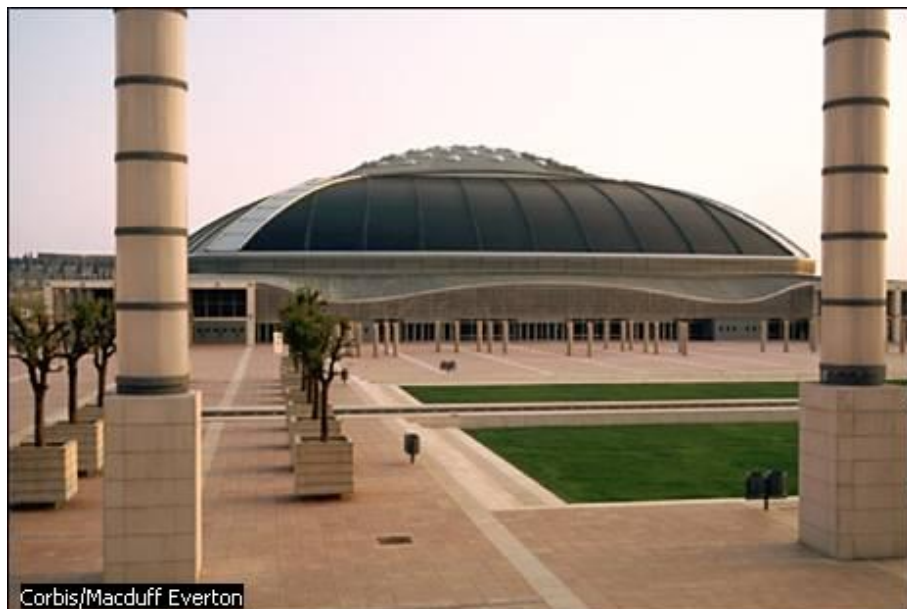
Palau Sant Jordi Sports Pavilion. Japanese architect Arata Isozaki designed the Palau Sant Jordi Sports Pavilion in Barcelona, Spain, for the 1992 Summer Olympic Games. Isozaki's designs are renowned for their blending of Eastern and Western architecture styles and their graceful, curved lines. Isozaki also designed the Museum of Contemporary Art in Los Angeles. Microsoft ® Encarta ® 2006. © 1993-2005 Microsoft Corporation. All rights reserved.