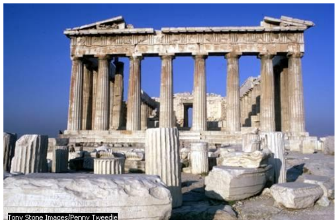
Tony Stone Images/Penny Tweedie

The Parthenon , 447 – 432 BC, is the greatest monument of the Golden Age of Athens, Greece. Originally a temple to Athena Parthenos (the Virgin Athena), eventually converted into a Christian church and later into a mosque. The structure survived largely intact until 1687, when the Turkish gunpowder stored inside it was detonated in the course of a siege by Venetian troops. Tony Stone Images/ Penny Tweedie. Microsoft Encarta © 2006. © 1993-2005 Microsoft Corporation. All rights reserved.