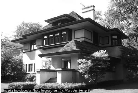
The Hills/ DeCaro house in Oak Park, west of Chicago, is one of more than 20 houses Wright designed while living in the town between 1890 and 1910.

Microsoft ® Encarta ® 2006. © 1993-2005 Microsoft Corporation. All rights reserved.