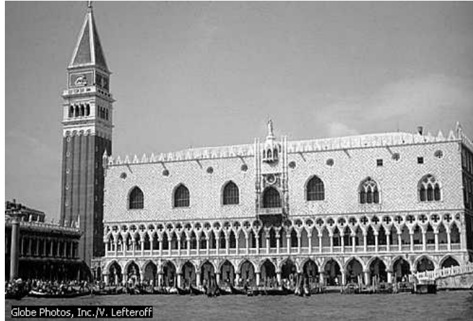
Doges' Palace , Venice, Italy, former residence of the doges (elected rulers) of Venice. Construction began in 1340. Interior is decorated with artwork by leading Venetian artists from the 15th and 16th centuries. Globe Photos, Inc./V. Lefteroff. Microsoft® Encarta® 2006.

berparade dengan meminjam langgam-langgam tersebut di atas namun hanya bersifat topeng atau tempelan pada penampilan mereka.