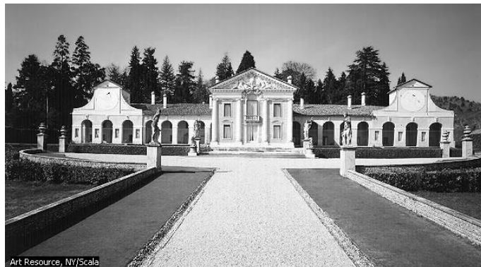
The Villa Barbaro , Maser, Italy, designed 1560 by Italian painter and architect Andrea Palladio. Influenced by classical Roman architecture, as can be seen in the use of statuary and the pediment with a frieze above the facade.