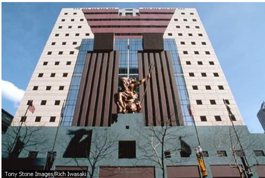
Portland Building. The Portland Building, opened in 1982, is one of the earliest monuments of postmodern architecture. Incorporating both ornamentation and sculpture (the allegorical figure Portlandia), the structure represents a break with the austere functionalism of the International Style that predominated in the mid-20th century.

Terdapat perbedaan mendasar antara karya seni lain dengan arsitektur dalam konteks sebagai karya seni. Kita dapat memilih dan menolak karya seni apa pun apabila kita menyukai atau tidak menyukainya. Namun tidak demikian halnya dengan karya arsitektur yang tidak dapat kita tolak, hindari, bahkan kita hilangkan apabila kita tidak menyukainya. Oleh karenanya faktor hati-hati, cermat, dan bertanggungjawab sangat dibutuhkan oleh seorang arsitek alih-alih kalau tidak mau dipersalahkan apabila rancangannya sedemikian rupa membuat pengguna tidak menyukainya karena tidak sukses menggunakannya.