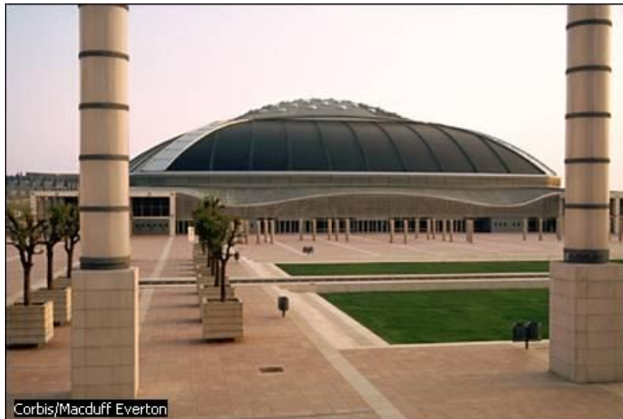
Palau Sant Jordi Sports Pavilion. Japanese architect Arata Isozaki designed the Palau Sant Jordi Sports Pavilion in Barcelona, Spain, for the 1992 Summer Olympic Games. Isozaki's designs are renowned for their blending of Eastern and Western architecture styles and their graceful, curved lines. Isozaki also designed the Museum of Contemporary Art in Los Angeles.