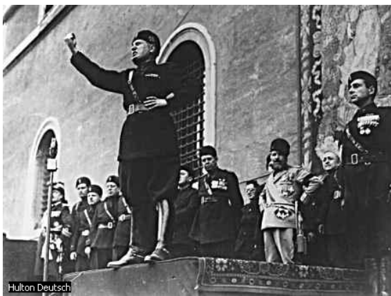
Benito Mussolini. Benito Mussolini led Italy from 1922 to 1943. He founded the first fascist political group and later allied his country with Germany in World War II. Mussolini took the title Il Duce (The Leader). His clenched fist, jutting jaw, fiery speeches, and dramatic poses became his trademarks.