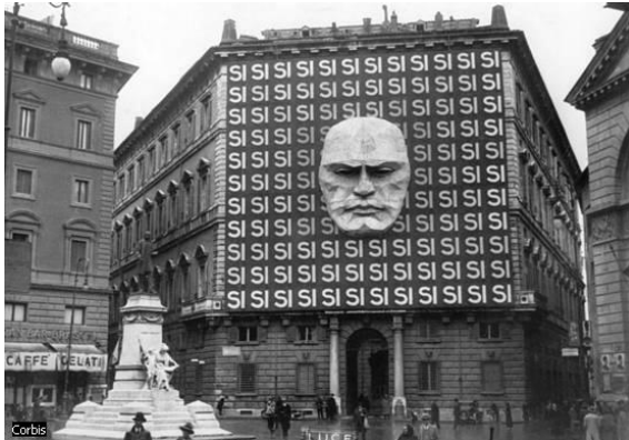
Fascist Propaganda. Italian dictator Benito Mussolini mobilized a vast propaganda machine to garner support for his regime. This picture shows the headquarters of the fascist movement in Rome, adorned with a large stylized representation of Mussolini's face. The word si, which is repeated over and over, is Italian for yes.