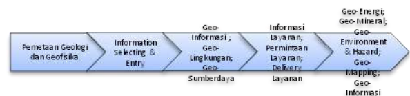
Gambar 1. Value Chain Informasi Geologi [2]

Dari fungsi bisnis yang didapat bahwa yang ditekankan adalah inti dari bisnis yang dijalani oleh Pusat Survey Geologi Bandung. Karena itu pendefinisian untuk dukungan fungsi bisnis tidak dibahas. Sehingga fungsi utama ini jika digambarkan dalam bentuk value chain [3], Michael Porter dapat dilihat pada gambar 1 berikut :