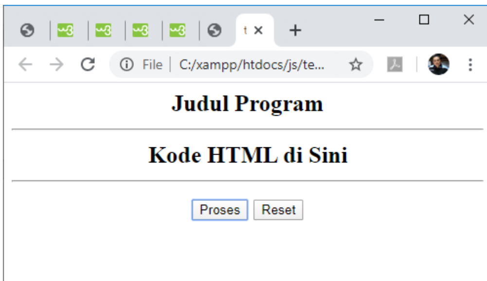
Gambar 5.1. Keluaran template.html

</script> <html> <center> <h2>Judul Program <hr> <table> Kode HTML di Sini </table> <hr> <input type=button value=Proses onclick="proses()"> <input type=reset value=Reset>